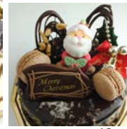
15cm 18cm 12cm