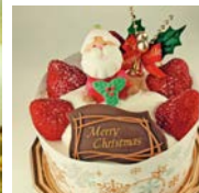
15cm 18cm 12cm